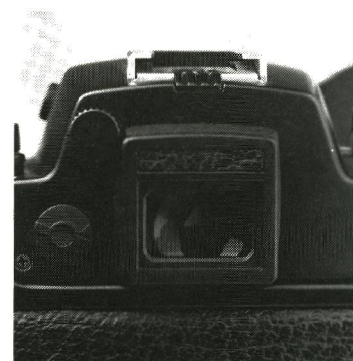
Nyt er dioptrijustering af okularet. Naturligvis er okularet også forsynet med lukker til brug ved f.eks. stativoptagelser.

til Tyrkiet, hvor jeg i mange situationer havde fordel af spotmålingen - når jeg ellers kunne lokke kameraet fra min kone. Hun havde nemlig, med vanlig sans for det eksklusive, straks fattet kærlighed til Leicaen, og kunne samtidigt nyde de lange blikke, som især de tyske turister kastede på »smykket«. Rent praktisk var det blot at stille om til P-programmet, og for at forebygge bevægelsesuskarphe- det sætte lukkertiden på 1/125 sek. Det fungerede glimrende med 35-70mm zoomen, som fulgte med til testen.