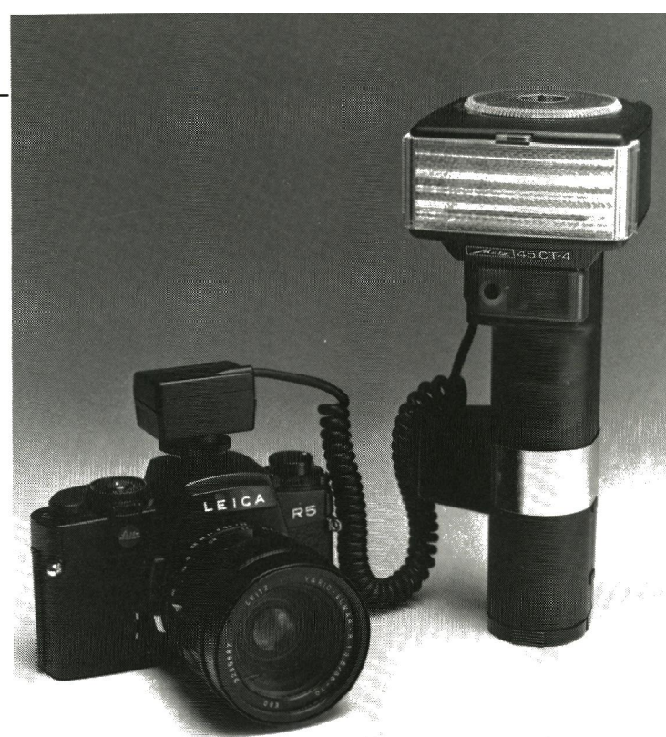
Leica R5 passer uden videre til markedets professionelle flashenheder under SCA-300 systemet.

I søgeren er de synlige forbedringer især, at informationer om lysmålerens forslag (afhængigt af program) til lukkertid og blændeværdi er rykket ud til