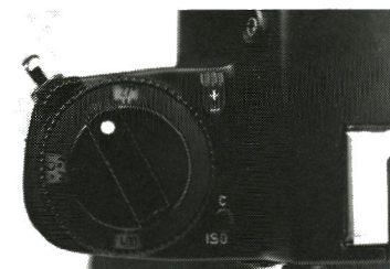
En usædvanlig, men meget vellykket udformning af ringen til plus/minus korrektion. Efter nedtrykning og drejning af den særlige låseknop, kan ringen forskydes med den forhøjede knap på ringen. Dette kan let klares med kameraet for øjet.